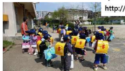
入学後の習ぐの期間、放課後ルームに集団場所する各人生

「がくどうほいくふなばし」 ホームページから http://fghrk.kids.coocan.jp/